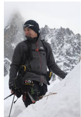
Summit Pro PWS Jacket aus Polartec Power Shield Pro