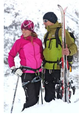
Belay Composite Jkts